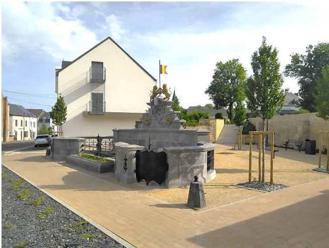
Place du champs de foire – septembre 2022

Il reste deux conventions en cours pour l'ancien PCDR : La place champs de Foire, inaugurée en octobre 2022.