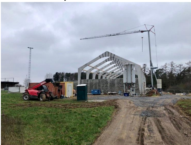
Maison rurale de Tintigny en travaux (février 2023)

Quant à la maison rurale de Tintigny, les travaux sont en cours. Le gros œuvre devrait être terminé à la fin du semestre. Le fonctionnement futur de la salle fait actuellement l'objet de rencontres avec le Patro et le centre culturel notamment.